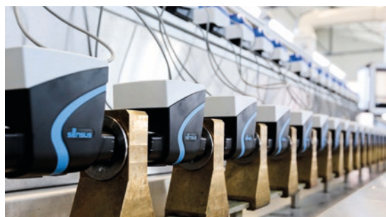
Wasserzähler in Reih' und Glied bei den Stadtwerken Bad König

überrascht, welchen Unterschied iPERL im Vergleich zu Flügelrad- und Ringkolbenzähler ausmacht.“