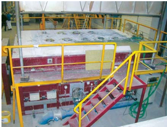
Abb.8 Prüfdecke mit nicht brennbaren Brandschutz-Bodenabläufen auf dem Testofen (MPA NRW)