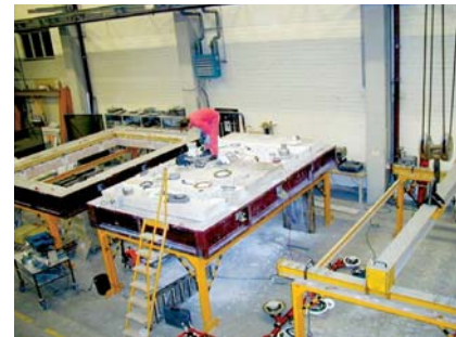
Abb.7 Montage der senkrechten Bodenabläufe in der Versuchsdecke

Es kam zu einer unerwarteten Dampfexplosion; 1 Liter Wasser ergibt 1700 Liter Dampf. Danach traten Flammen aus dem Bodenablauf (Abb.6).