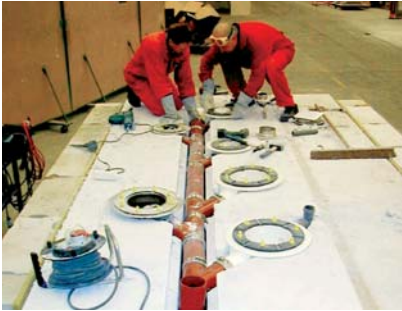
Abb.5 Montage waagerechter Bodenabläufe in der Versuchsdecke (MPA NRW)