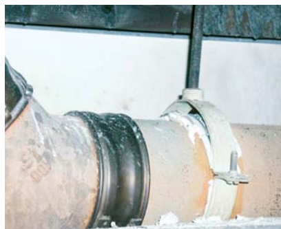
Abb.4 Schalldämmeinlage in der Rohrschelle weggebrannt, Gussrohr senkt sich

wie die diffusen Angaben im Bereich der allgemein anerkannten Regeln der Technik gaben letztlich den Anstoß zur genaueren Prüfung der physikalischen Vorgänge bei einem Brand unter der Decke im Bereich von Bodenabläufen. Erste Versuche zeigten sehr schnell, dass eine Gussrohrleitung alleine keinen ausreichenden Schutz bietet. Für weitere Versuche wurden Bodenabläufe aus Gusseisen und Edelstahl in eine entsprechende Betonplatte eingegossen (Abb.1).