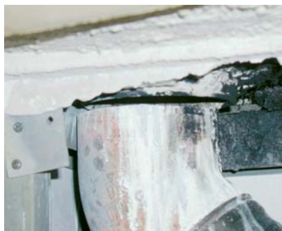
Abb.3 Gussrohr senkt sich, Öffnungen werden frei