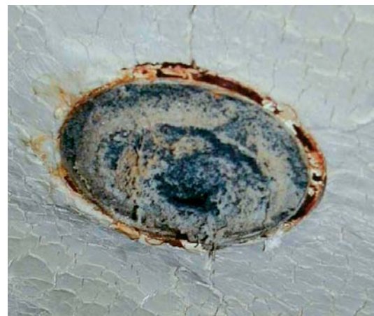
Abb. 9 Bodenablaufstutzen mit Feuer und Rauchverschluss nach einem Brand (ACO Passavant)

Die derzeitigen Angaben für die Brandschutzprüfung von Bodenabläufen sind für die Bodenabläufe mit waagrechttem Auslaufstutzen, bei denen die angeschlossene Rohrlei-