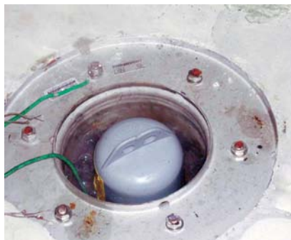
Abb.2 Kochende Wasservorlage