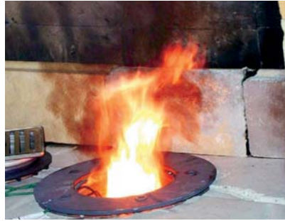
Abb.6 Feuer und Rauch treten aus dem Bodenablauf aus