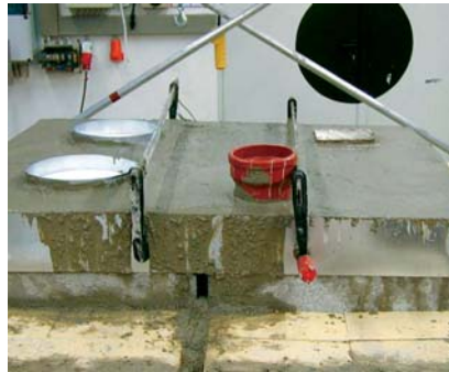
Abb.1 In Betondecke eingegossene Abläufe

Die beschriebene Situation, die teilweise erschreckende Unkenntnis so-