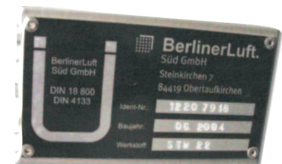
Abb. 4 Beispiel Ü-Kennzeichen der BerlinerLuft Süd

Neben der Prüfstatik ist laut Bauregelliste A Teil 1 Ausgabe 97/1 für vorgefertigte Bauprodukte die Kennzeichnungspflicht durch das Ü-Kennzeichen (Übereinstimmungserklärung nach dem DIBt in Berlin) erforderlich. Das