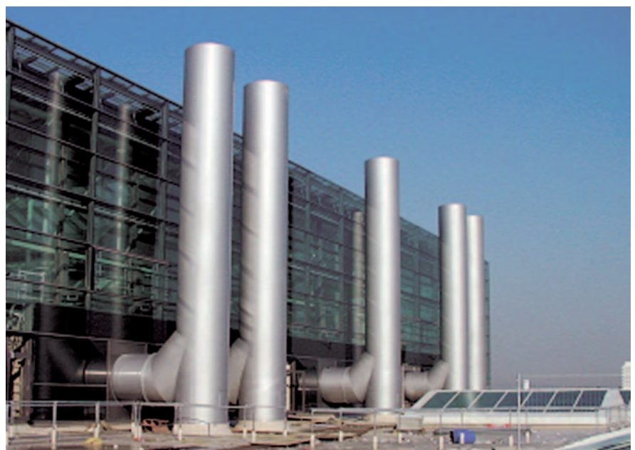
Abb. 1 Lackierte Fortluftkamine, Flughafen München, Terminal 2

Schornsteine < 2 m Gesamthöhe werden von dieser Norm nicht erfasst und dürfen folglich auch von jeder Metallbaufirma produziert werden. Ein Eignungsnachweis ist nicht erforderlich. Für den Fachplaner gibt es zu dieser Regelung noch Folgendes zu beachten: Die obige Norm gilt lediglich für freiste-