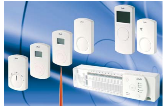
Danfoss CF-2 Familie

Mit dem neuen aus drei Komponenten bestehenden CF-System von Danfoss lassen sich Raumtemperaturen über eine Fußbodenheizung oder Heizkörper per Funk regeln und zonenweise programmieren. Die drahtlose Kommunikation in einem weiteren Haustechnikbereich bedeutet einen erheblich reduzierten Installationsaufwand sowohl beim Neubau als auch bei der Renovierung.