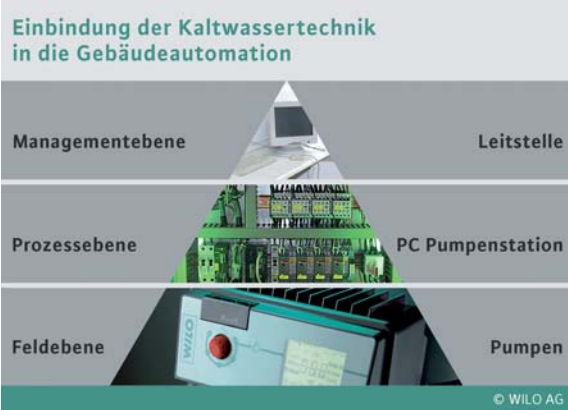
Abb.5 Pumpeneinbindung in GLT

sind bei den elektronisch geregelten Hochdruck-Kreiselpumpen auf drei Wegen möglich: