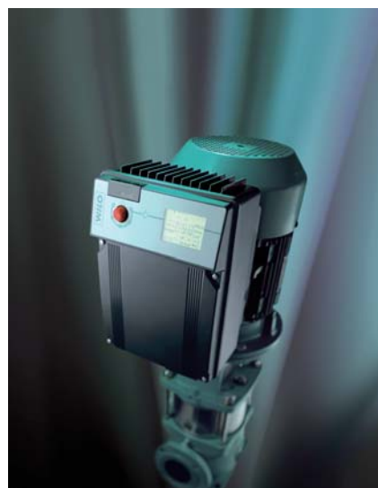
Abb.4 Elektronisch geregelte Hochdruck-Kreiselpumpe Wilo-Multivert MVIE

abzuspeichern. Hierdurch können alle inneren Zustandsgrößen des Motors wie zum Beispiel die Stromanteile für die Magnetisierung und die Bildung des Drehmoments sowie die Drehzahl des Rotors kontinuierlich berechnet werden. Die Eingangsgrößen für das im Prozessor abgebildete Motormodell sind die Wicklungsströme, die innerhalb des Umformers gemessen werden. Die Ansteuerung des Pumpenmotors erfolgt nun exakt so, dass die Wicklungsströme kontinuierlich gemessen und