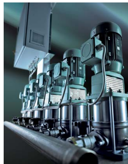
Abb.2 Schaltgerät Comfort-Controller, fortschrittliches System für die Steuerung von Druckerhöhungsanlagen

tor werden Drehzahl und Drehmoment durch die magnetische Wechselwirkung von Stator- und Rotorfeld erzeugt. Ein Drehmoment erzeugt dabei nur derjenige Stator-Stromanteil, der senkrecht zum Rotorfeld steht („Drei-Finger-Regel“). Hieraus leitet sich der Begriff der feldorientierten Regelung ab. Beim AC-Motor muss ein Teil des Gesamtmotorstromes für die Magnetisierung des eisenbehafteten Rotors aufgebracht werden. Dieser Magnetisierungsstrom bewirkt zusätzliche Statorwärmeverluste, die vom Motorlüfter an die Umgebung abgegeben werden. Wird der Motor in