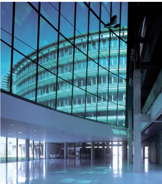
Abb.1 Erhebliche Einsparpotenziale in größeren Gebäudekomplexen durch Integration der Kaltwassertechnik in die Gebäudeautomation

Ein Bereich, in dem es interessante Potenziale zur Kostenoptimierung gibt, ist die Wasserversorgung zum Beispiel mit Trink-, Brauch- oder Löschwasser. Hier kommen anlagenseitig Hochdruck-Kreiselpumpen oder auch Druckerhöhungsanlagen aus mehreren zusammenschalteten Pumpen zum Einsatz. Ein zunehmend wichtiges Auswahlkriterium für Planer und Betreiber ist dabei die Energieeffizienz. Denn der Stromverbrauch stellt einen nicht zu unterschätzenden Kostenfaktor dar. Vor allem die größeren Ausführungen mit Nennleistungen von mehreren Kilowatt können – je nach Einsatzprofil und Betriebszeiten – Stromkosten von mehreren hundert Euro pro Jahr verursachen. Hohe Einsparpotenziale bieten moderne, drehzahlgeregelte Pumpen. Hier wird bei wechselnden hydraulischen Lasten (zum Beispiel im häufig anzutreffenden Teillastbetrieb) die Pumpendrehzahl automatisch an den tatsächlichen Förderbedarf angepasst, so dass erhebliche Energieeinsparungen im Vergleich zu unregulierten Pumpen zu verzeichnen sind.