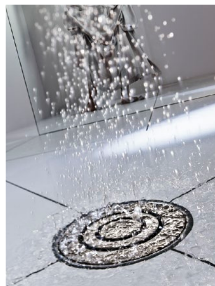
Abb.2: Bodengleiche Duschen bieten dem Nutzer höchsten Komfort – und sichern dem SHK-Handwerk steigende Umsätze. Um eine Durchfeuchtung des Estrichs zuverlässig zu verhindern, ist die Einbindung über eine Verbundabdichtung gemäß ZDB-Leitfaden der sicherste Weg.

Verbundabdichtungen sind in Kombination mit Punkt- oder Linienentwässerung in bodengleichen Duschen problemlos und sicher, wenn nur wenige Grundsätze beachtet werden (Abb.4). Denn damit