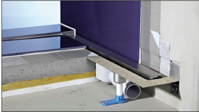
Abb.3: Wird die AIV durchgehend ohne Aufkantung am Ablauf und ohne Silikonfuge mit der Duschrinne verbunden, kann kapillar eingedrungene Feuchtigkeit diffundieren und abtrocknen.

angeschweißten Fliesenanschlusswinkeln sind nicht geeignet, weil sie die AIV unterbrechen (Diese Lösungen werden überwiegend im Großküchenbereich angewendet).