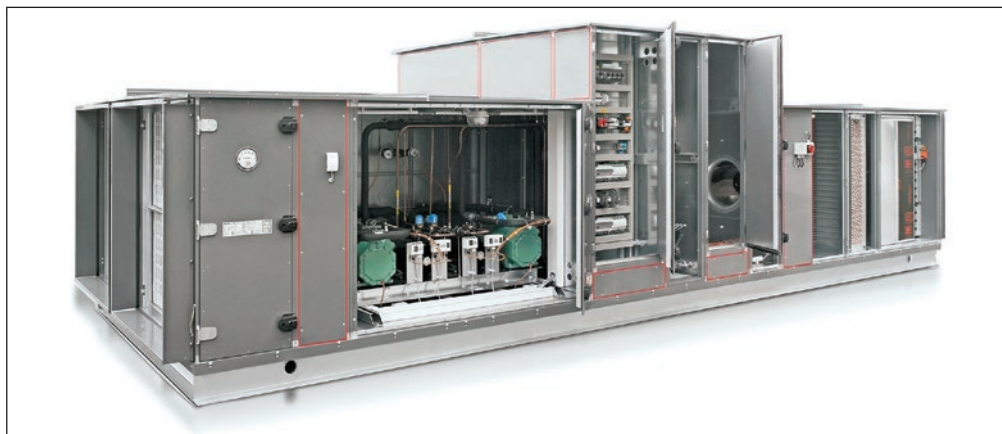
Abb.2: Kälteleistungen von bis zu 140 kW (mit Frequenzumformer) und bis zu 500 kW bei Hubkolbenverdichter lassen sich in die Wolf-RLT-Geräteserie KG Top integrieren. Der zusätzlich benötigte Platz ist vergleichsweise gering.

gesetzten Systemtechnik um eine direkt expandierende Kälteanlage mit Kältemittel als Kälteträger handelt (anstatt Wasser bzw. Wasser/Glykol), besteht weder Einfriergefahr noch das Risiko, dass austretendes Wasser sensible Einrichtungen