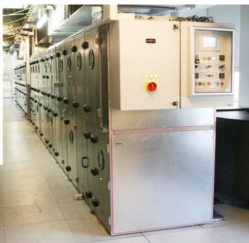
Abb. 1: Für gebäudetechnische Anlagen wird immer weniger Platz zur Verfügung gestellt. RLT-Geräte mit integrierter Kälteanlage erweitern den Spielraum für TGA-Fachplaner.

Nebenflächen von Gebäuden werden heute aufgrund wirtschaftlicher Überlegungen intensiver genutzt. Die gebäudetechnische Infrastruktur muss sich diesem Trend unterordnen. Anstatt großzügig dimensionierter Technikräume werden den TGA-Fachplanern für die Technik immer häufiger Nischen zugeteilt. Hinzu kommt der Trend zur Nachrüstung von RLT-Anlagen in Bestandsgebäuden und Anbauten. Oftmals bleibt dem Planer dort nur die Wahl, das RLT-Gerät auf dem Dach, neben dem Gebäude oder in einer meist engen, bereits bestehenden Technikzentrale aufzustellen. Wolf hat diese Entwicklung frühzeitig erkannt und schon vor mehr als zehn Jahren, in Zusammenarbeit mit einem Kältefachunternehmen, platzsparende RLT-Geräte mit integ-