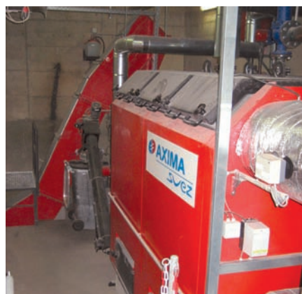
Abb.4 Neuer Hackschnitzelkessel nach Sanierung

Weiteren wurde ein neuer Reindampferzeuger eingebaut. Maßgeblich sind der Verzicht auf unnötige Reserven und die Auslegung aller Komponenten auf den tatsächlichen Bedarf der Verbraucher.