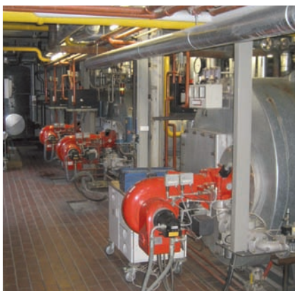
Abb.3 Heizkesselanlage vor Sanierung

Wasser vorgesehen. Zusätzlich wird die RLT-Anlage der Krankenhausküche erneuert. Wie die Analyse des Energiespezialisten zeigt, können allein durch die Installation von neuen Dampferzeugern 74 % der bisher benötigten Gasmenge für die Bereitstellung eingespart werden. Die installierte Dampfleistung wurde von 2.500 kg/h auf 820 kg/h reduziert und damit an den aktuellen Bedarf des Hauses angepasst. Des